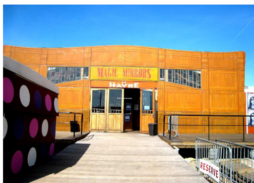
Le Magic Mirrors

Cette manifestation était organisé conjointement par la Ville du Havre (Musées historiques), l’Université de Metz (CEGUM), l’Université du Havre (CIRTAI), le Centre Havrais de Recherche Historique (CHRH), et l’association « Clipperton – Projets d’Outre-Mer (CPOM).