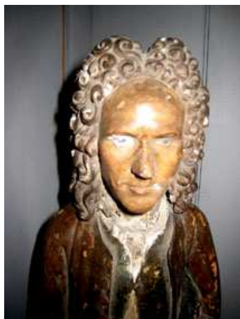
Statuette de Dubocage Musée Dubocage de Bléville

Une cinquantaine de dossiers de Presse (réalisé par Alain Duchauchoy) ont été envoyés à tous les médias régionaux et aux grands médias nationaux.