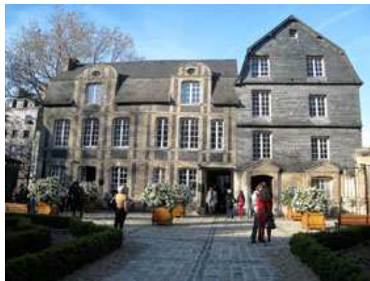
Hôtel Dubocage de Bléville.