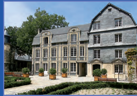
L'Hôtel Dubocage de Bléville, XVII e siècle. Monument Historique - Musée de France