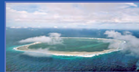
L'île de la Passion (Clipperton).