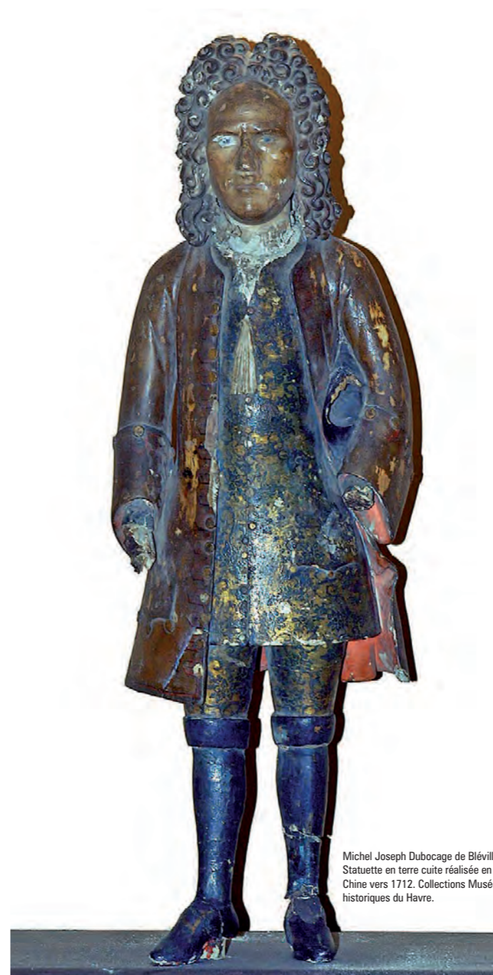
Michel Joseph Dubocage de Bléville. Statuette en terre cuite réalisée en Chine vers 1712. Collections Musées historiques du Havre.

18 h 30, à l'Hôtel Dubocage de Bléville : Inauguration de l'exposition MICHEL JOSEPH DUBOCAGE DE BLÉVILLE (1676-1727), entre découvertes et négoce maritime.